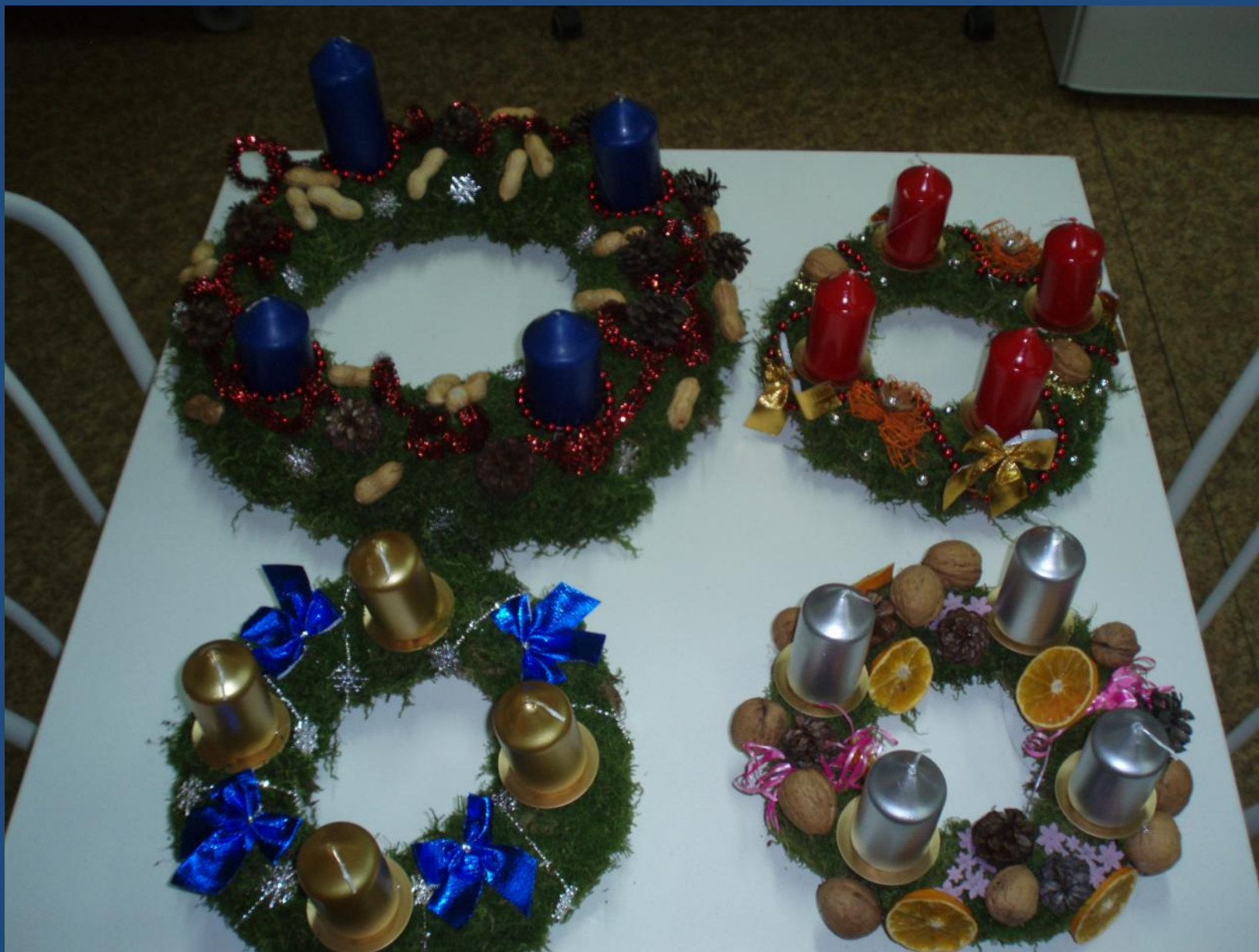
Inkriminované adventní věnce