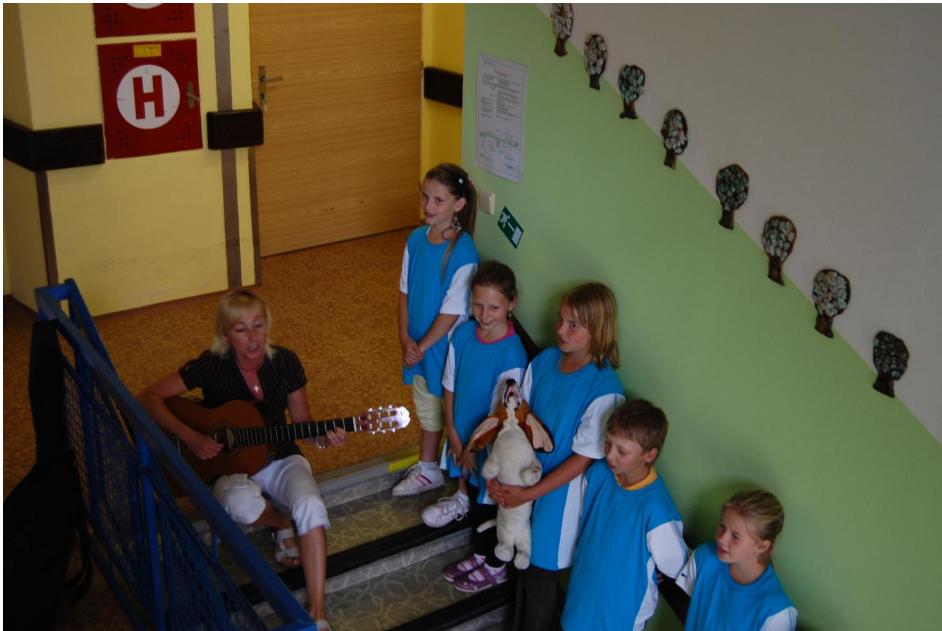
Minivernisáž u příležitosti otevření expozice